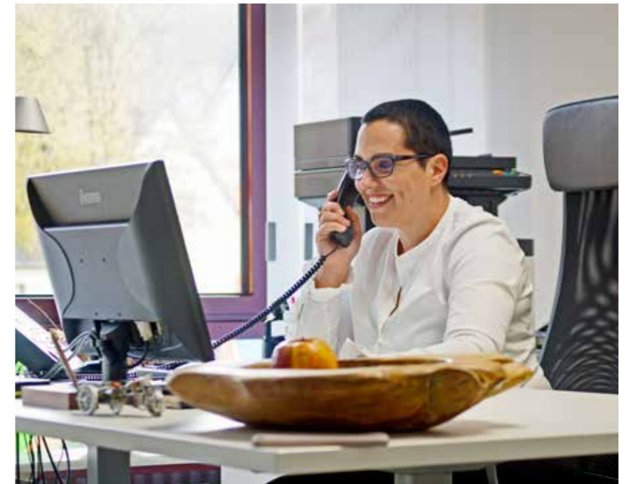
„Kein Tag gleicht dem anderen.“

„Erstens: Steuerreform! Ich habe Mitarbeiterinnen, die Teilzeit arbeiten und schon fast erwachsene Kinder haben. Doch wegen der Lohnsteuerklasse 5 gibt es oft kein Interesse daran, mehr zu arbeiten. Denn der Staat nimmt ihnen 50 Prozent weg. Was denken Sie, wie viele in der Pflege und auch vielen anderen Berufen davon betroffen sind? Gerechtigkeit und Gleichstellung werden in diesem Bereich vom Staat völlig ignoriert. Die Wertschätzung fehlt komplett. Das würde ich sofort ändern. Dann entspannt sich vieles.“