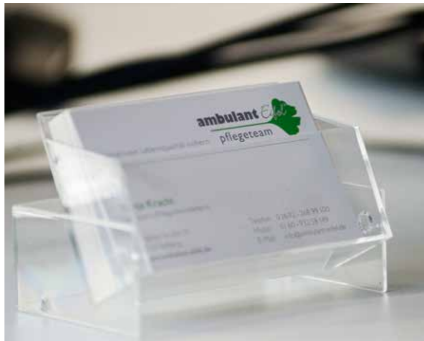
Ihr Pflege-Ansprechpartner in der Eifel.