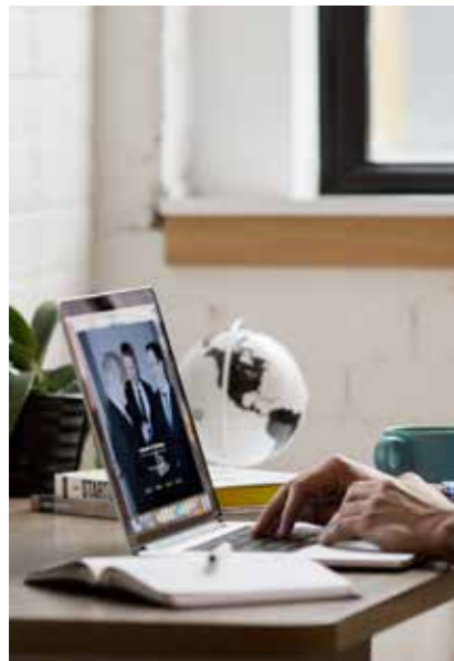
Digitale Zusammenarbeit via Cloud.

KAUFMÄNNISCHE PROZESSE ÜBER DIGITALE PLATTFORMEN SICHER VERBINDEN