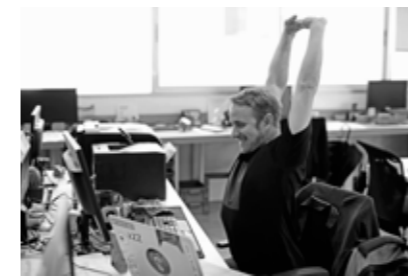
Fit am Arbeitsplatz.

In der Branche der Steuerberater ist man – wie in so vielen anderen – meist im Sitzen tätig. Sport und Bewegung werden bei Lehnen und Partner zwar groß geschrieben – doch das gemeinsame Training auf dem Fußballplatz oder im Park muss in der Regel bis nach Feierabend warten. Damit die am Schreibtisch verbrachten Stunden nicht zu einer ungesunden