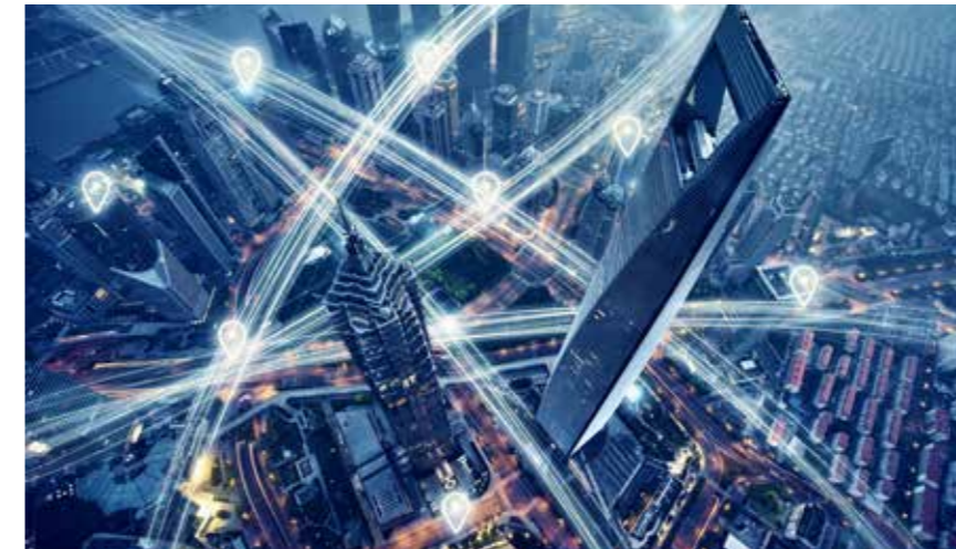
Höchste Effizienz dank vernetzter Prozesse.

rend des Jahres wichtige Hinweise zur Unternehmenssteuerung geben. Viele Steuerberatungsunternehmen setzen für die digitale Zusammenarbeit mit den Mandanten auf DATEV Unternehmen online als gemeinsame Arbeitsplattform. Um den Weg in die Cloud zu finden, stehen für die Belegdaten dabei unterschiedliche Kanäle zur Verfügung – etwa der Scanner, das Fax oder das Smartphone. Im Rechenzentrum der DATEV sind die Belege dann rechtssicher archiviert und stehen gleichzeitig in der Cloud bereit. Es ist sogar möglich, die Papier-Originale anschließend zu vernichten – allerdings muss dazu im Unternehmen zusätzlich ein entsprechendes Scan-Verfahren aufgesetzt und dokumentiert werden, sodass sich die korrekte Entstehung des Belegbildes nachweisen lässt. Unabhängig davon hat die Digitalisierung aber in jedem Fall Vorteile: Da die Daten über das Netz bereitgestellt werden, kann die Steuerberatungskanzlei ebenfalls darauf zugreifen. Damit die zentrale Datenbasis nicht zur Gefahr werden kann, ist der Zugriff bestmöglich abgesichert. Der Anwender muss sich mittels einer Hardware-Komponente in Kombination mit einer PIN-Eingabe authentifizieren und die Verbindung mit dem Rechenzentrum wird immer über eine VPN-Tunnelung geschützt.