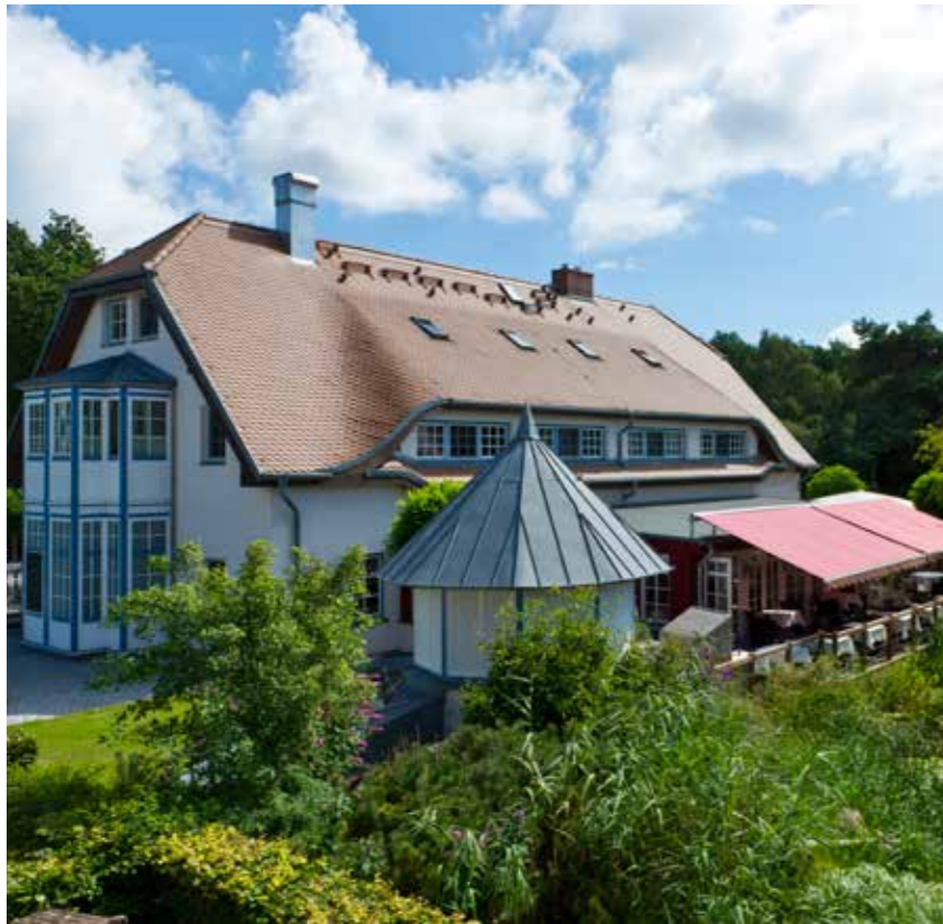
Das Hotel Fürst Jaromar freut sich auf Sie!

Nicht nur die Eifel-Region ist einfach zauberhaft. Auch im Osten Deutschlands lohnen viele Gegenden einen Besuch. Etwa Rügen, Deutschlands größte Insel. Weitläufige Strände und eine beeindruckende Natur – inklusive der weltberühmten Kreidefelsen und uralter Buchenwälder – sind zu jeder Jahreszeit eine einzigartige Kulisse und zählen zu den schönsten Regionen Deutschlands.